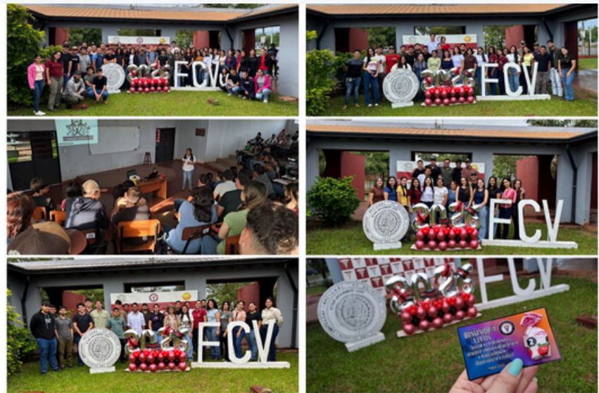
FCV UNA - FILIAL CONCEPCIÓN