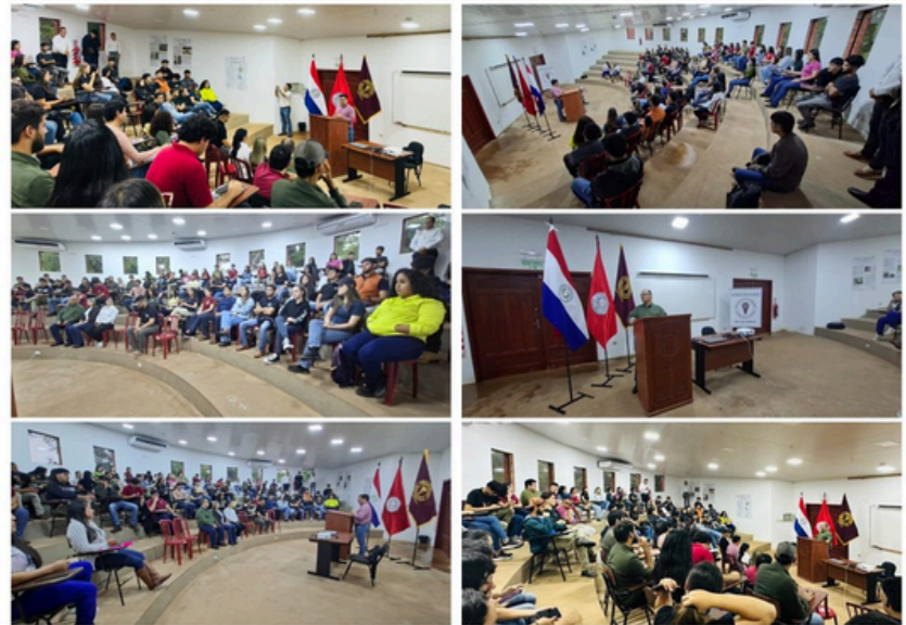
FCV UNA - FILIAL SAN ESTANISLAO