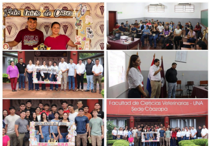
FCV UNA - FILIAL CAAZAPÁ

La jornada tuvo como objetivo acompañar a los ingresantes en sus primeros pasos dentro de la vida universitaria, brindándoles orientación, integración y apoyo en esta nueva etapa académica. Durante la actividad, se socializó el Reglamento Académico, se explicaron las normativas de Extensión Universitaria y se destacó la importancia de la bioseguridad en la formación veterinaria. Asimismo, representantes del Centro de Estudiantes dieron la bienvenida a los nuevos alumnos, compartiendo información clave sobre la participación estudiantil y las diversas oportunidades que ofrece la facultad.