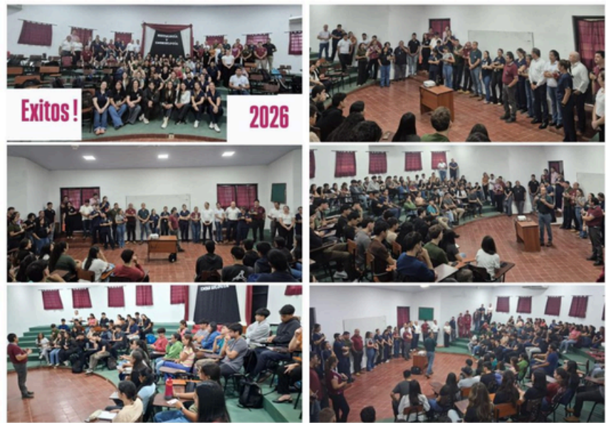
FCV UNA - FILIAL SAN JUAN BAUTISTA MISIONES